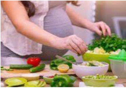
14 ගර්භණී මවකට සුදුසු දිවා ආහාර බොජුන් පතක් ලියන්න