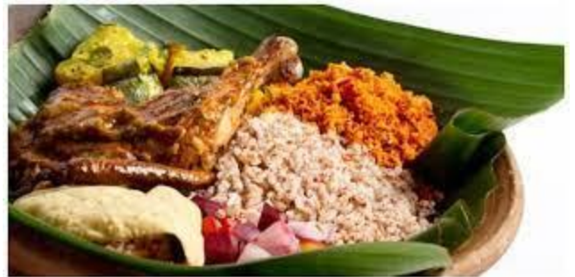
15 මහළු වියේ පසුවන ආච්චි අම්මට සුදුසු දිවා ආහාර වේලක් ලියන්න